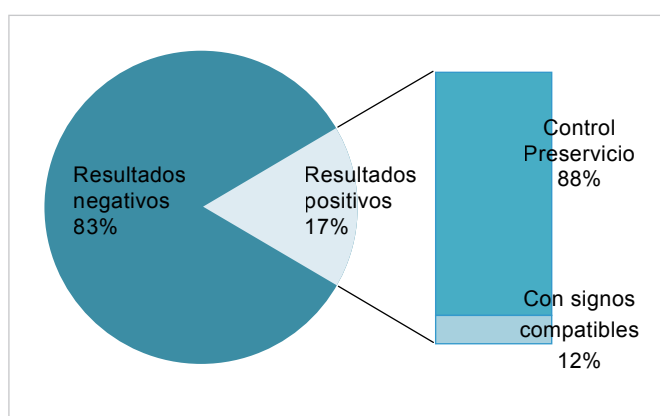
Figura 3: Motivo de consulta según resultados a la detección de anticuerpos para brucelosis. La signología clínica compatible con Brucelosis fue aborto (en el último periodo), orquitis, uveítis y dolor articular

El diagnóstico canino de la infección por B. canis puede resultar difícil, debido a la inestabilidad de los títulos de anticuerpos séricos que varían de acuerdo a la fase de la enfermedad, sea aguda o crónica así como entre los diferentes métodos empleados en su detección. El diagnóstico se basa en el aislamiento del agente, difícil de realizar y fundamentalmente en la evidencia serológica, usando pruebas de aglutinación o de inmunodifusión en gel de agar. El aislamiento bacteriológico es el estándar de oro, sin embargo debido a que la bacteria se expulsa en forma intermitente, un cultivo negativo no se puede utilizar como