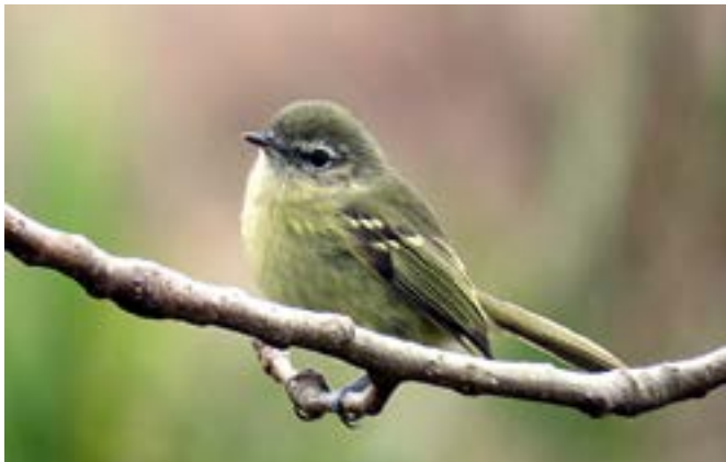
Figura 1: Mosqueta común ( Phylloscartes ventralis ).

Algunos migradores estivales, como el benteveo rayado ( Myiodynastes maculatus ), el chiví ( Vireo olivaceus ) y el anambé común ( Pachyrhamphus polychopterus ) nidifican en la zona en primavera y vuelan hacia el norte al detectar el descenso de la temperatura que indica la llegada de la temporada invernal. También se observan especies características de la selva ribereña que bajando desde el río de la Plata desde el norte ven un sitio adecuado en el tupido follaje del Jardín, ejemplos son la mosqueta común ( Phylloscartes ventralis , Fig. 1), el arañero coronado chico ( Basileuterus culicivorus , Fig. 2), la tacuarita azul ( Poliophtila dumicola ) y el pitiaiyumí ( Parula