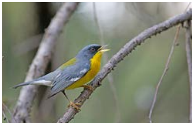
Figura 3: Pitiayumí ( Parula pitiayumi ).