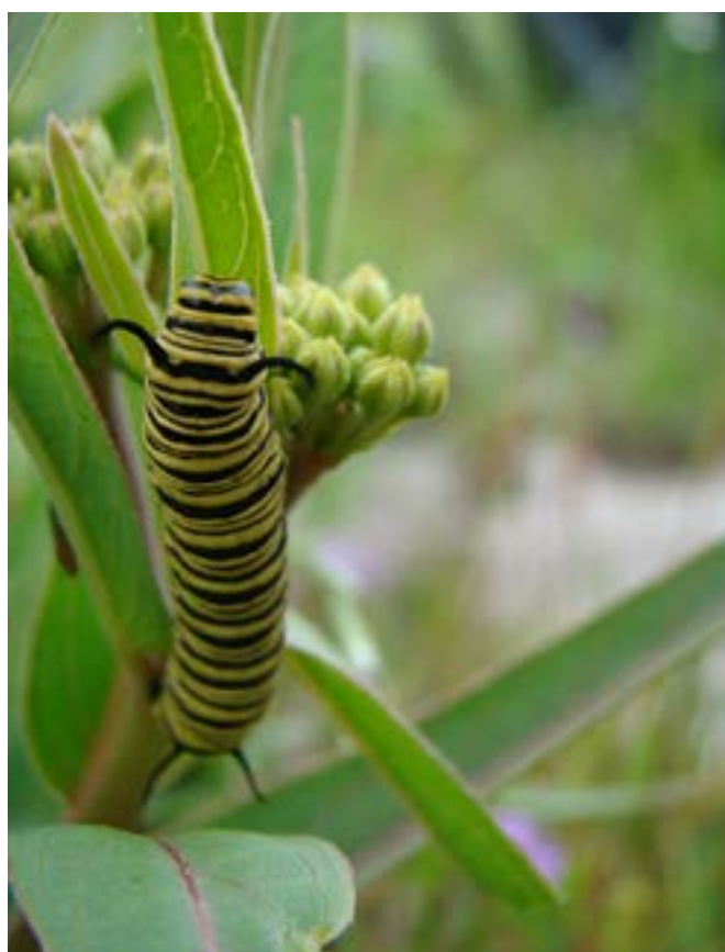
Figura 6: Mariposa monarca ( Danaus plexippus ) en Asclepias curassavica .

Un tupido bosque protegido, con una fuerte presencia de árboles nativos y en medio de un corredor verde que desciende desde Misiones, parecía ser un paraíso para la vida silvestre en un equilibrado ecosistema en medio de la ciudad, hasta que apareció una gran amenaza: gatos ( Felis silvestris catus , Fig. 11). Hace varias décadas atrás, el Jardín Botánico se transformó en el hogar de felinos abandonados por sus dueños. Comenzaron a reproducirse descontroladamente hasta llegar al número de 500 individuos en el año 2006, una cifra preocupante. Si bien muchos de ellos eran animales nacidos en cautiverio, y a pesar de que muchos vecinos se acercaban a alimentarlos, pronto sus instintos cazadores hicieron inevitable encontrar en las aves e incluso en las comadreas presas fáciles para cazar y alimentarse. Al mismo