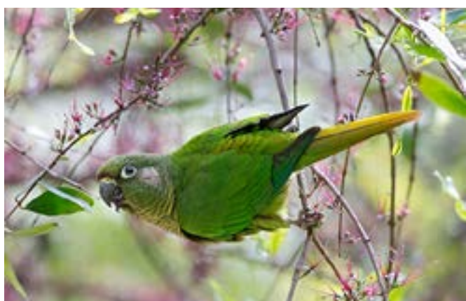
Figura 9: Chiripepé cabeza verde ( Pyrrhura frontalis ).