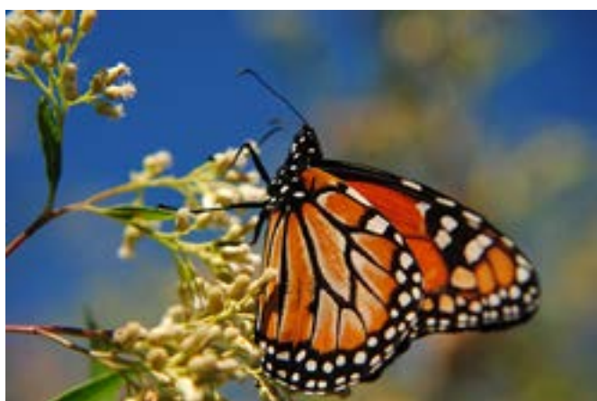
Figura 5: Mariposa monarca ( Danaus plexippus ).

de 6 especies de loros originarios del norte de Argentina, como el calancate ala roja ( Psittacara leucophthalmus ) y el chiripepe cabeza verde ( Pyrrhura frontalis , Fig. 9), cuyas poblaciones posiblemente sean derivadas del tráfico ilegal de fauna silvestre, se alimentan de los árboles de sus regiones de origen generando una situación asombrosa: una especie de ave exótica alimentándose de su flora nativa en un lugar creado artificialmente por el ser humano.