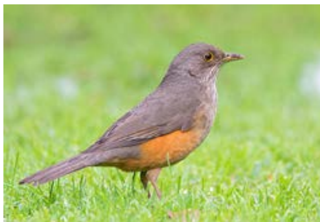
Figura 8: Zorzal colorado ( Turdus rufiventris ).