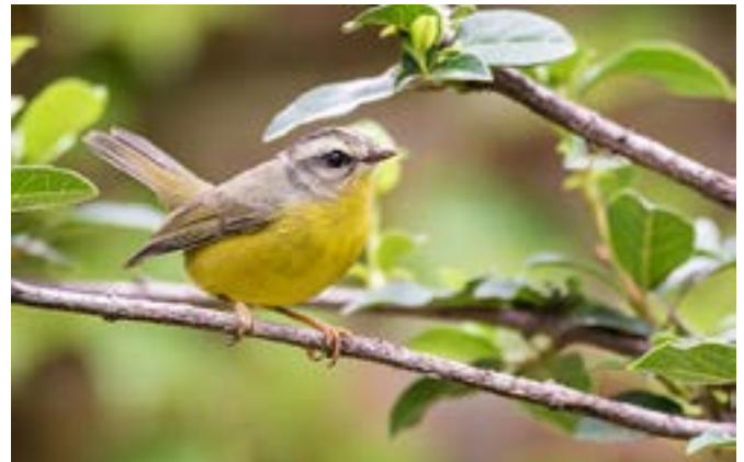
Figura 2: Arañero coronado chico ( Basileuterus culicivorus ).

pitiaiyumi , Fig. 3), quien es escuchado vocalizar en cada rincón. Aun así, las aves más simbólicas son las dos especies de picaflores ( Hylocharis chrysura y Chlorostilbon lucidus , Fig. 4), que en primavera liban el néctar de las flores dispersando varias especies de plantas y árboles nativos de Buenos Aires, ubicados en 5 hectáreas del predio dedicadas exclusivamente a las flores de Argentina. La presencia de estas plantas nativas es un factor fundamental que explica la diversidad de aves, pues no sólo les proveen de alimento, sino también les brindan sitios de nidificación. Así mismo se detectaron más de 85