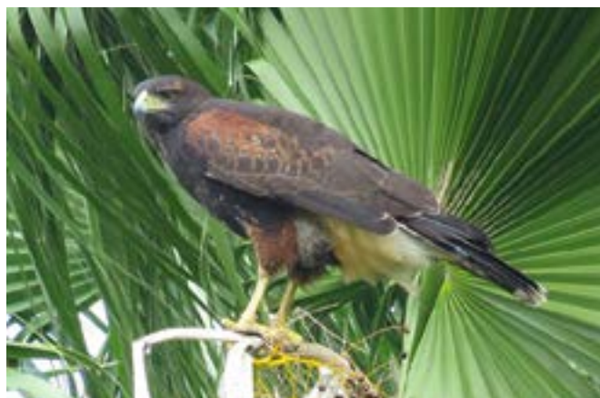
Figura 12: Gavilán mixto ( Parabuteo unicinctus ).