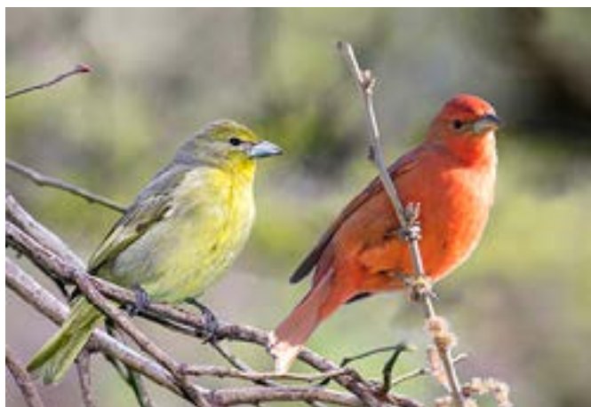
Figura 7: Fueguero común ( Piranga flava ).