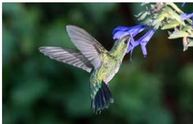
Figura 4: Picaflor común ( Chlorostilbon lucidus ) libando Salvia guaranitica .