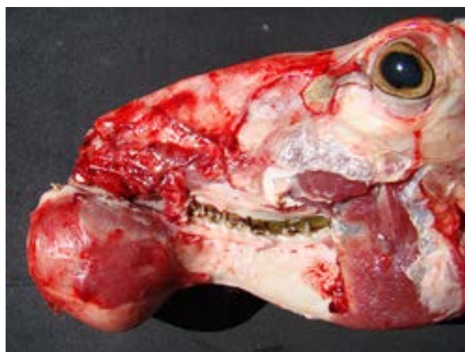
Figuras 1b: Aspecto y ubicación mandibular de un quiste odontogénico en uno de los animales afectados

Cuando se indagó sobre la presencia de la enfermedad en otros 11 establecimientos ovejeros de la zona, se determinó que sobre 2298 carneros sometidos a revisión clínica pre servicio, 29 tenían lesiones compatibles con las descritas, arrojando una prevalencia promedio de 1,3%, con un rango de 0,6% a 2,9%, viéndose afectados animales de diferentes edades, desde carneritos de 12-18 meses, hasta carneros de 2, 3, 4 y más años de vida.